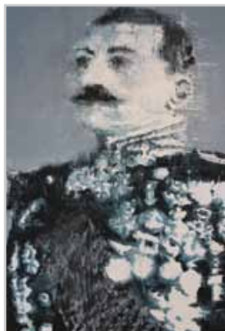
Pierre Loti en académicien

En partenariat avec la commune de Saint-Pierre d'Oléron